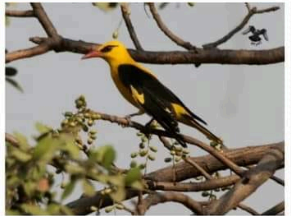
السند 1: طائر الصفاري يتغذى أساسا على الحشرات

إعتادا على الأسناد المقدم إليك ومكتسباتك القبلية أجب عما يلي: